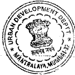
(Sanjay Saoji) Deputy Secretary to Government

By order and in the name of Governor of Maharashtra,